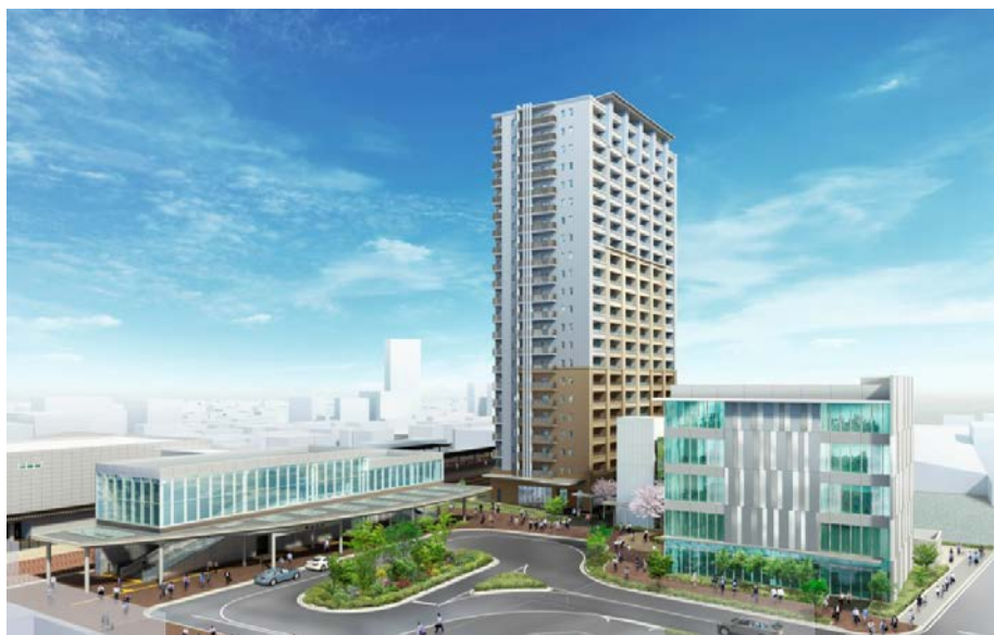
« 建築物のイメージパース »